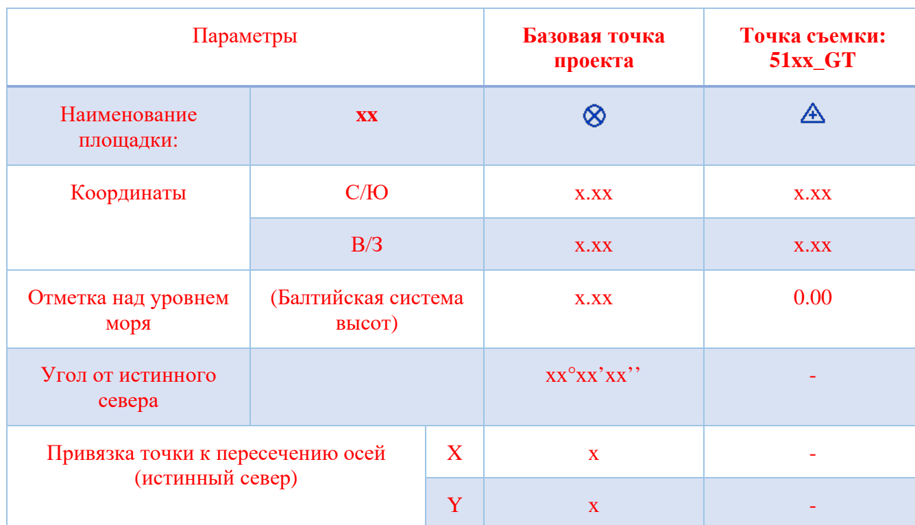
[Таблица 6 – Пример заполнения протокола ЦИМ]

12.2.4. [В соответствии с таблицей 6, необходимо предусматривать в ЦИМ: